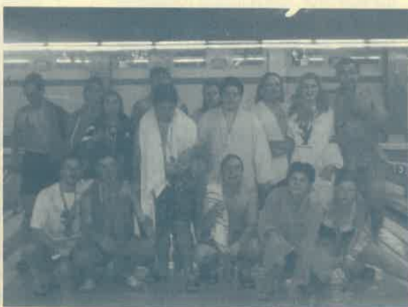
Las piscinas municipales de San Amaro acogieron las pruebas de natación.

La semana finalizó el sábado, 28 de septiembre con un Encuentro regional de pruebas adaptadas psicomotrices, al que se sumaron doce asociaciones más procedentes de la Comunidad de Castilla y León.