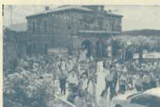
El Ayuntamiento serrano, en fiestas.

Otra novedad fue que al voluntariado se les vistió de indios, no para que hicieran el indio sino para que supiéramos que ellos son los que