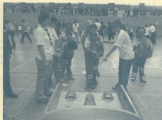
Los deportistas, durante la jornada de pruebas psicomotrices adaptadas.

Del 23 al 28 del pasado mes, once asociaciones burgalesas de personas con discapacidad intelectual y física tomaron parte en este evento deportivo. Atletismo, natación, Boccia, baloncesto en silla de ruedas, fútbol sala y tenis de mesa fueron los deportes protagonistas durante seis días en diferentes instalaciones deportivas de la ciudad: pistas de atletismo