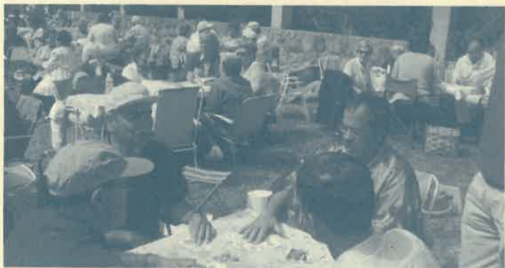
Después de la comida, una partidita.

Empezamos curso nuevo, pero os voy a contar mi experiencia del final del curso. Como sabéis, el pasado 14 de julio fue el día de las familias en Quintanar de la Sierra, donde pudimos compartir mesa, juegos y sobre todo convivir unos con otros, como una gran familia que somos..