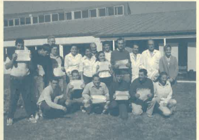
Alumnos y técnicos de Aspanias.

Dos profesionales de Aspanias se han encargado de impartir el conjunto de los contenidos teóricos y prácticos durante las 720 horas que ha durado el curso. Durante este tiempo, los alumnos han trabajado sobre materiales como madera, metal, plástico, piedra, corcho y goma, utilizando herramientas diversas y logrando perfectos acabados. Su