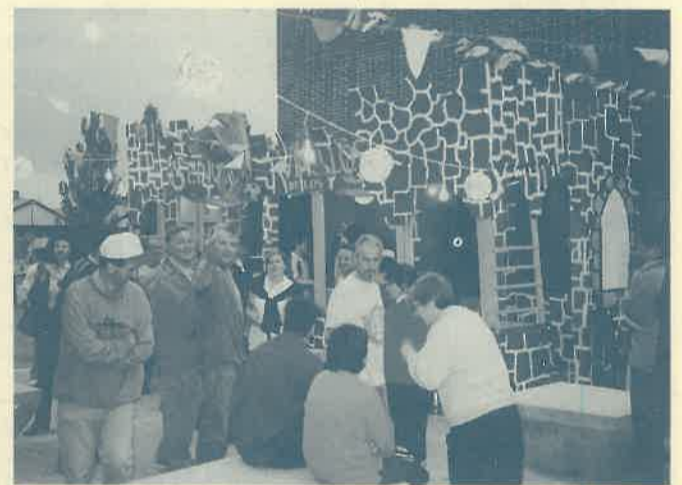
El servicio de vivienda de Aspanias.

Por la mañana hicimos un baile vermouth en los jardines del centro donde la mayoría se llevó numerosos premios en los concursos de la "Barraca" que este año habíamos confeccionado con el tema "Del señor de los anillos". Acabamos la tarde con una cena especial para todos los que viven o trabajamos en el G-3 y pisos. Después de cenar hicimos la hoguera de rigor y la entrega de premios para los más afortunados. Como novedad hubo una espléndida exhibición de fuegos artificiales de la Marca J.R.R., que fueron muy aplaudidos por todos los presentes, entre los que estaban numerosos vecinos del barrio y algunos compañeros de renombre.