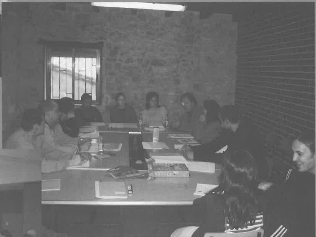
20 de Abril.-El servicio de Familias realiza un encuentro para informar y sensibilizar a las familias de los autogestores sobre la importancia que está cobrando el movimiento de autogestión para el desarrollo de las personas con discapacidad.