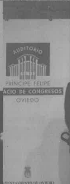
17 Diciembre.- Clausura del II Foro Consultivo de Feaps, para reflexionar y debatir sobre el futuro de la organización, que en Oviedo ha congregado durante tres días a un gran número de representantes del movimiento asociativo FEAPS, entre ellos un grupo de directivos y técnicos de Aspanias.