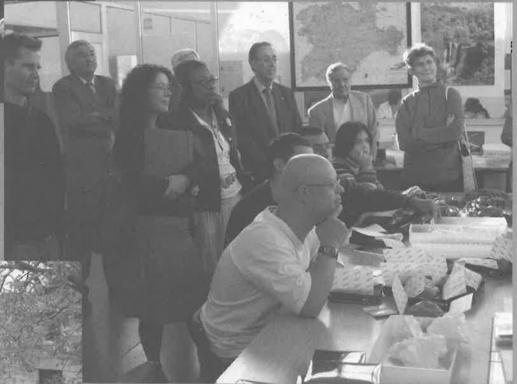
28 Septiembre.-Un grupo de expertos europeos en formación y empleo, visitan Aspanias por mediación del INEM, en el marco de un programa de estudios e intercambio del CEDEFOP: Centro Europeo para el Desarrollo de la Formación Profesional.