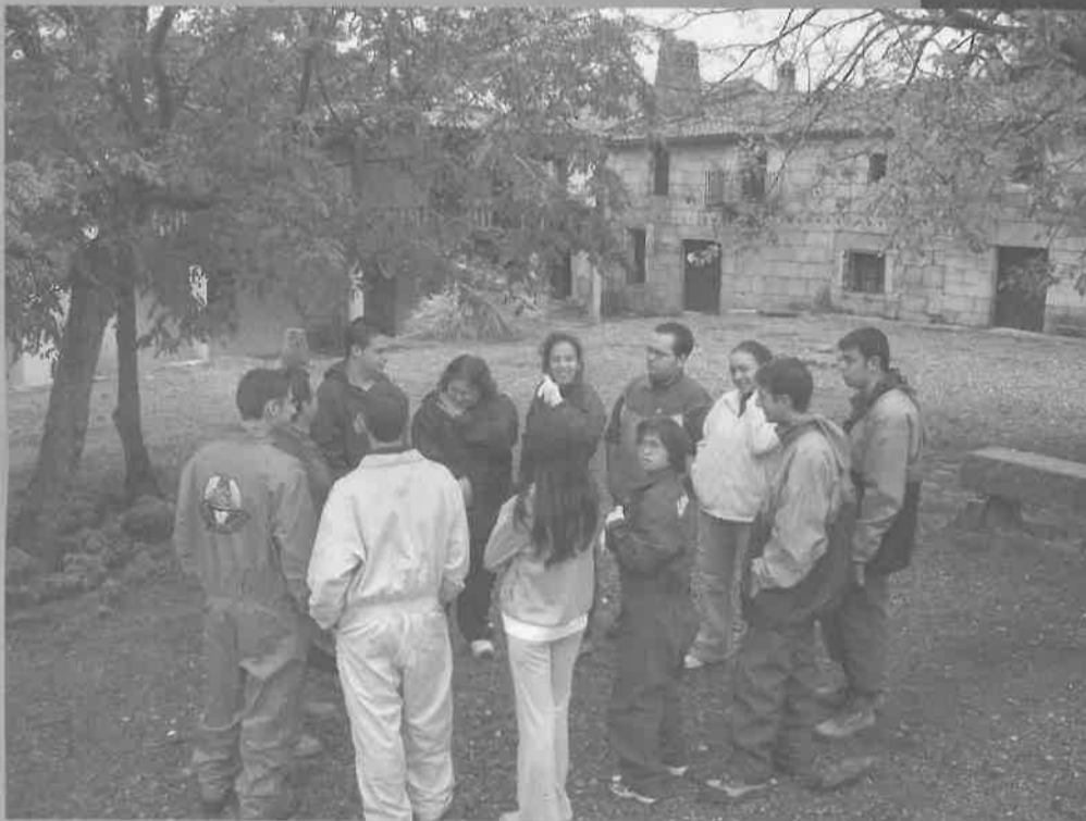
16 Octubre.-Alumnos y profesores del Centro de Formación Puentesaúco viajan a Granadilla (Cáceres) para participar en el programa de Recuperación y Utilización Educativa de Pueblos Abandonados, promovido por el Ministerio de Educación.