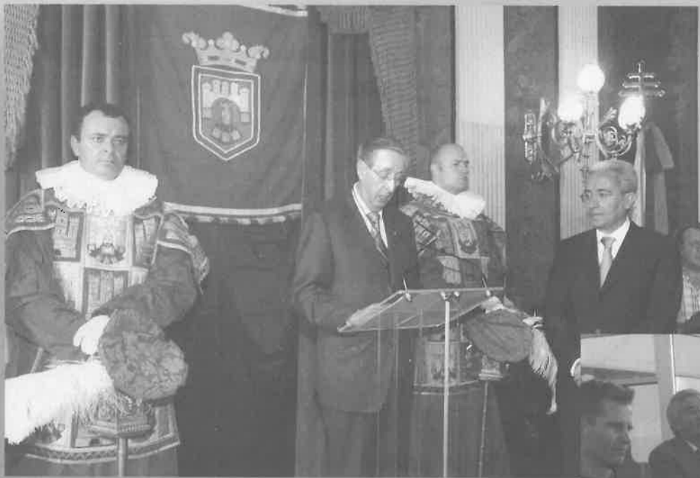
3 Septiembre.-Aspanias recibe la Medalla de Oro de la Ciudad de Burgos, máxima distinción que el Ayuntamiento concede. En este caso por el trabajo de la asociación a favor de las personas con discapacidad intelectual.