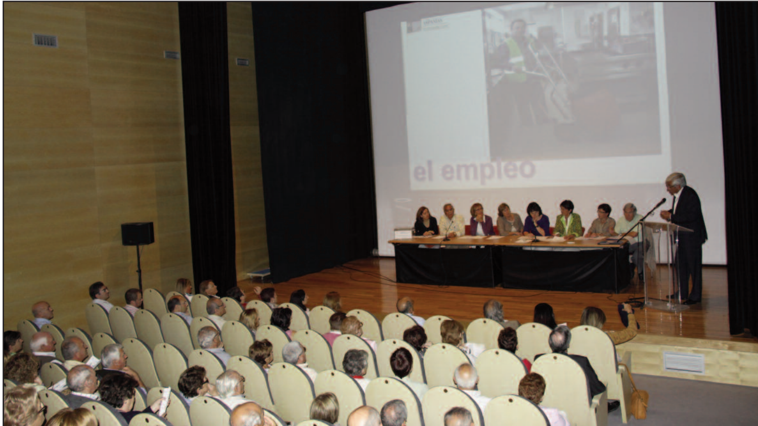
Los socios de Aspanias, se reunieron el pasado 1 de octubre en Asamblea Extraordinaria, para votar distintos proyectos de interés para la Entidad.