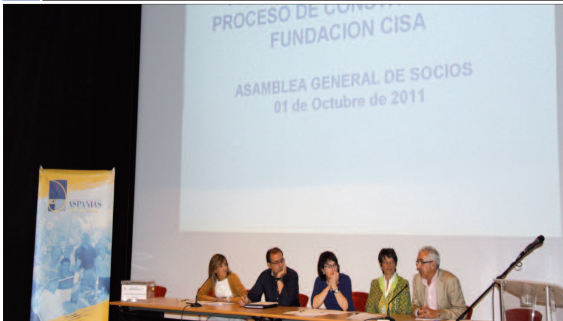
Responsables del proyecto informan a la asamblea sobre la Fundación CISA.

El grupo Aspanias quiere poner en marcha una nueva fundación. Se llamará CISA que significa Fundación Integral de Servicios de Aspanias.