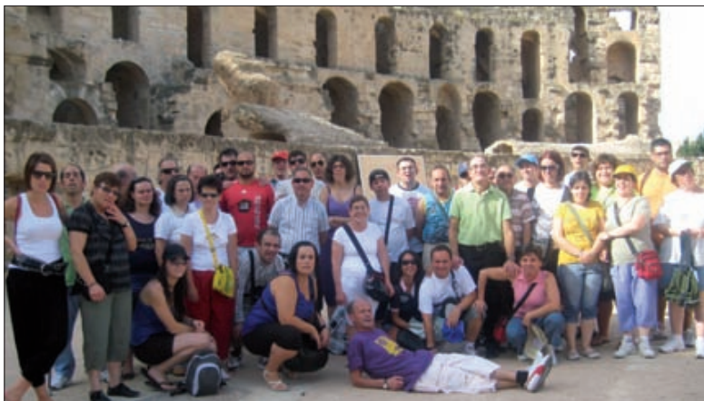
El anfiteatro romano de El Jem fue una de las visitas programadas durante el viaje de una semana por Túnez.

Los cuatro ya están pensando en el siguiente viaje, y todos coinciden: Europa (Grecia o Italia).