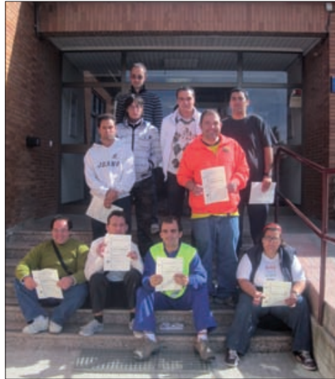
Los alumnos psan con sus diplomas.

Desde el año 2004, Aspanias tiene en marcha una serie de acciones -y distintos programas- de apoyo al empleo para personas con discapacidad, que cuentan con la colaboración y financiación de las administraciones