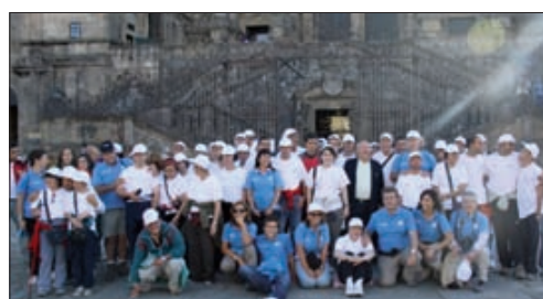
La comitiva de peregrinos, a su llegada a Santiago, el pasado 25 de septiembre.