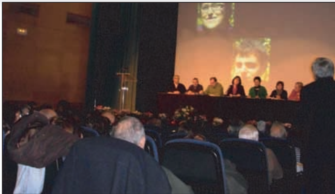
Alrededor de 200 personas asistieron a la última Asamblea General de Socios del año.