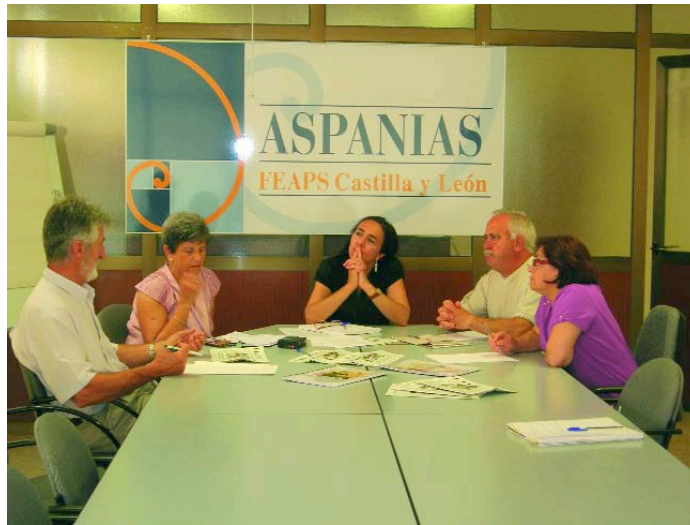
Un momento del café coloquio mantenido entre la redacción de La Almena y un grupo de socios de Aspanias.