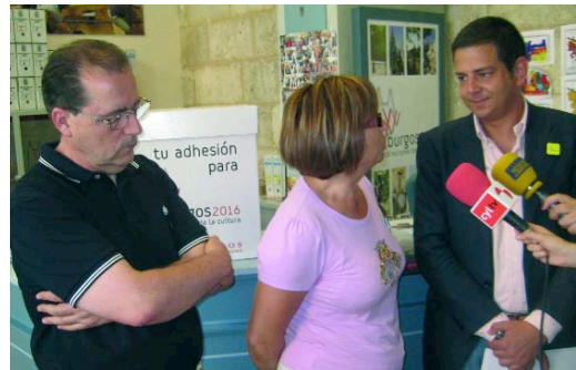
Directivos de Aspanias entregan al presidente del IMCYT las firmas recogidas.