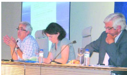
La presidenta de Aspanias, durante el acto de presentación de CISA a los familiares de los trabajadores del CEE. Junto a ella, Ibáñez (dcha.) y Camarero.

En el turno de preguntas, trabajadores y familiares expresaron su preocupación por cómo afectará el proyecto CISA a la situación laboral y personal de muchos de ellos.