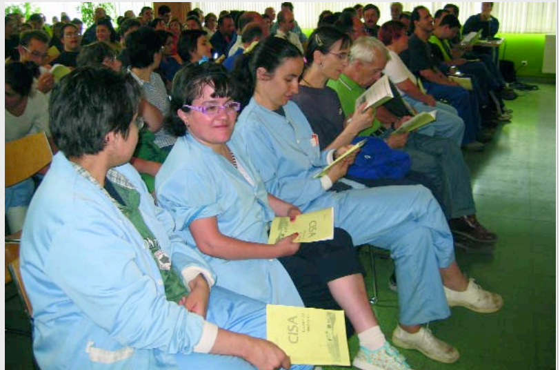
Trabajadores del CEE de Aspanias atienden a la información ofrecida por los dirigentes de la entidad, el pasado 23 de julio.

El encuentro, celebrado el pasado 23 de julio, logró reunir a la totalidad de la plantilla del CEE (cerca de 200 trabajadores) y a un buen grupo de familiares de estos trabajadores, interesados en saber más sobre el nuevo proyecto laboral, económico y social en el que Aspanias trabaja desde hace dos años. Si se cumplen las previsiones CISA arrancará en octubre de este año. página 2