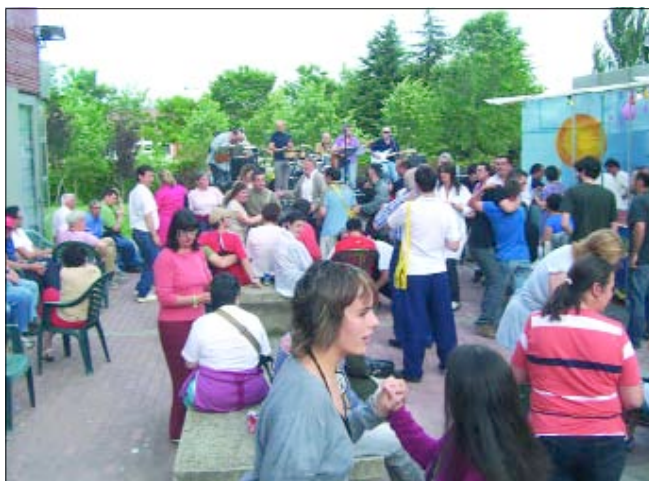
San Juan. El Área de Vivienda ha dado este año la bienvenida a la noche de San Juan por todo lo alto: pregón, chupinazo, juegos de barraca, bailes de salón, exhibición de cetrería, concurso de baile, música de orquesta y hoguera. Cerró fiesta el grupo "Eslabón".

C/ Federico Olmeda, 1 · 09006 BURGOS · Telf. 947 23 85 62 · Fax 947 23 85 13 · correo electrónico: aspanias@feapsyl.org · www.aspaniasburgos.org Composición, maquetación, redacción y edición: Delma Vicario Vicario (Departamento de Comunicación de Aspanias) · comunicacion@aspaniasburgos.com Impresión: ARTECOLOR IMPRESORES · Depósito Legal: BU-555-1996