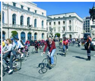
Después, los ciclistas: 10 kms.