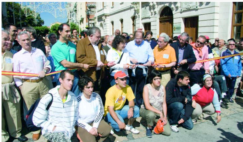
Los protagonistas de la Campaña de este año y las autoridades dieron la salida desde El Espolón rumbo a Fuentes Blancas.