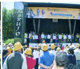
PCDI y autoridades compartieron mensaje.