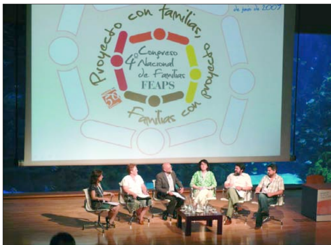
La voz de Aspanias, en el Congreso de Familias. La Confederación Feaps ha reunido en Valencia (junio '09) a las familias de PCDI. Allí, Aspanias presentó el Libro Blanco de la Participación y habló del proyecto asociativo de familias.