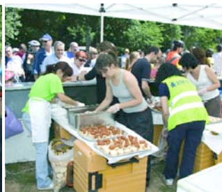
Al final del trayecto aguarda un refrigerio.