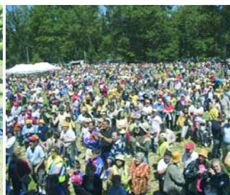
Ya en la campa, baile y sorteo de regalos.