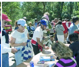
Los carnes se sellan al entrar al recinto.