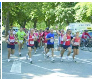
El Club Tragaleguas fue fiel a la cita.