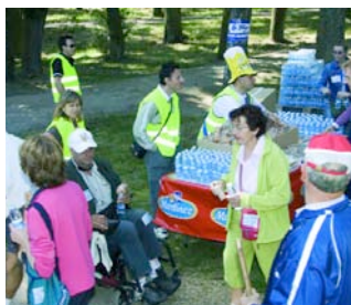
Durante el trayecto se ofrece un tentempié.