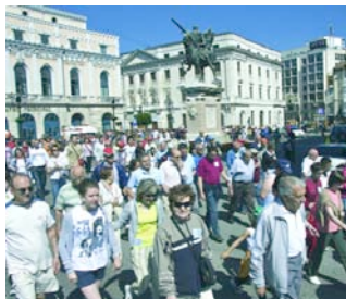
Primero salen los andarines: 7 kms.