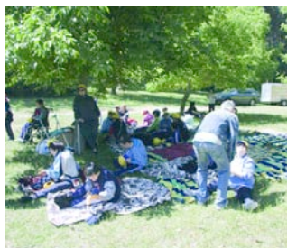
Muchos usuarios se apuntaron a la fiesta.