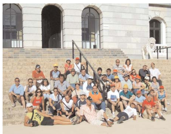
Matalascañas. Centro Especial de Empleo