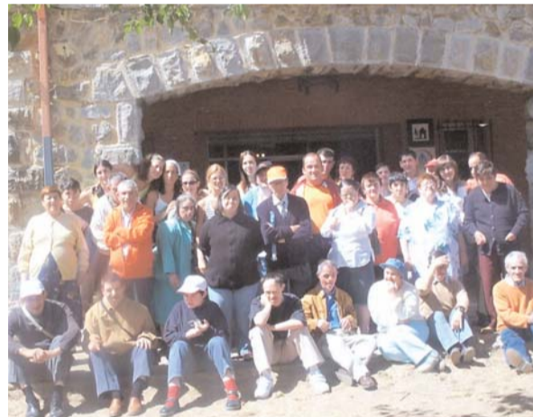
Arbejal (Palencia). Unidad Asistencial.