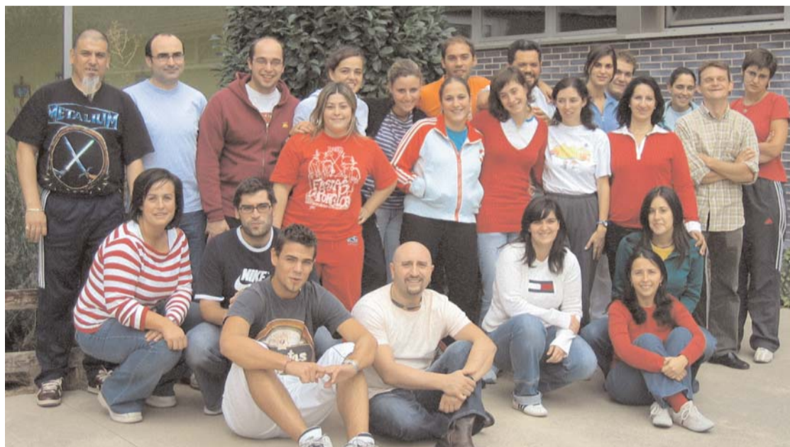
Algo más de 40 personas desarrollan tareas de voluntariado en las áreas de Ocio, Cultura y Deporte de la asociación.