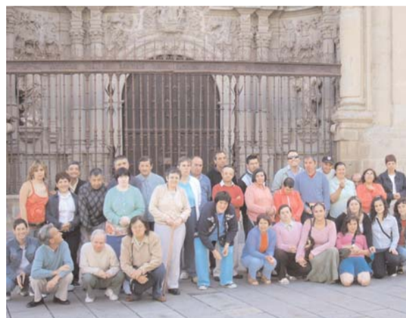
Lardero (Logroño). Centro Ocupacional y Unidad Asistencial.