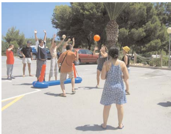
La Marina de Elche (Alicante). Centro Ocupacional.