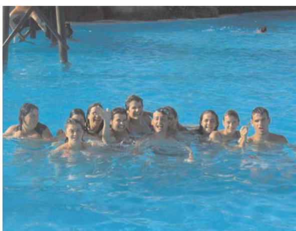
La Marina de Elche (Alicante). Centro Ocupacional, Formación y Centro Especial de Empleo.