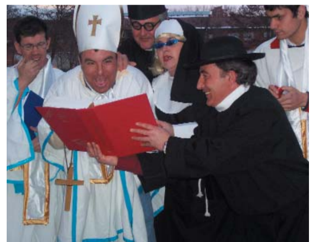
El área de vivienda prefirió acercarse a los religiosos.