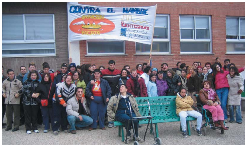
Con pancarta a la Operación Bocata. Usuarios de la Unidad Asistencial y alumnos del centro Puentesauco han repetido en la Operación Bocata, el acto solidario que desde hace siete años se celebra en el patio del colegio del Círculo Católico. Su apoyo a esta causa queda bien patente en la super pancarta que pintaron.

la actualidad, de un vistazo-----la actualidad, de un vistazo