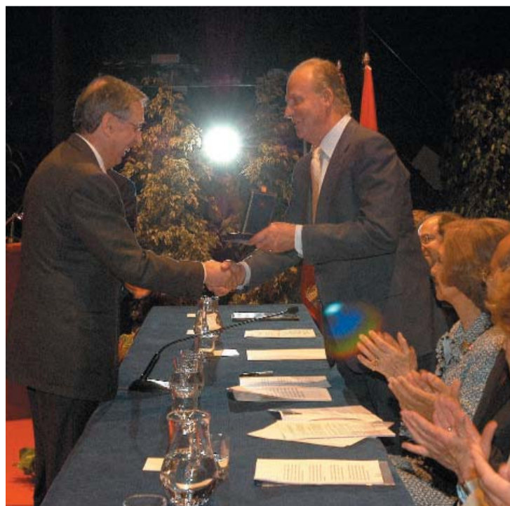
El presidente de Aspanias recoge el galardón de manos del Rey Don Juan Carlos.

Tan sólo otra organización burgalesa, la Hermandad de Donantes de Sangre, recibió este galardón que anualmente entrega Cruz Roja Internacional.