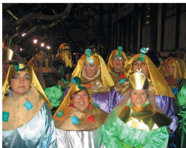
En el área de Ocio se vistieron de egipcios@s.