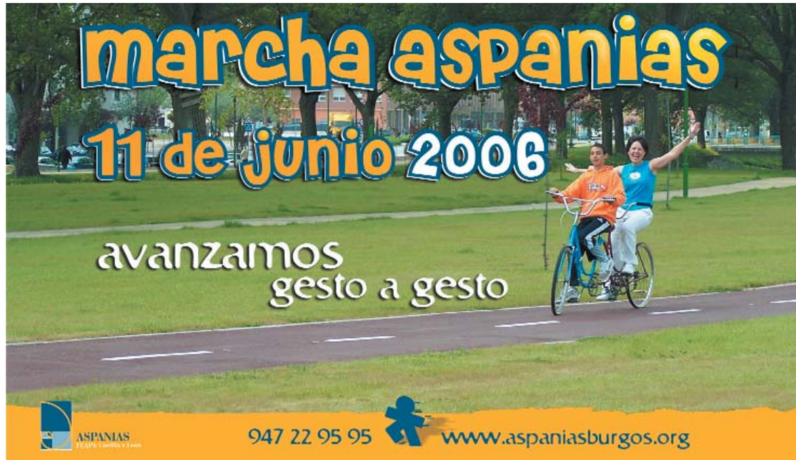
La palabra "gesto" vuelve a presidir por tercer año consecutivo el lema de la Campaña de Presencia Social y la marcha.