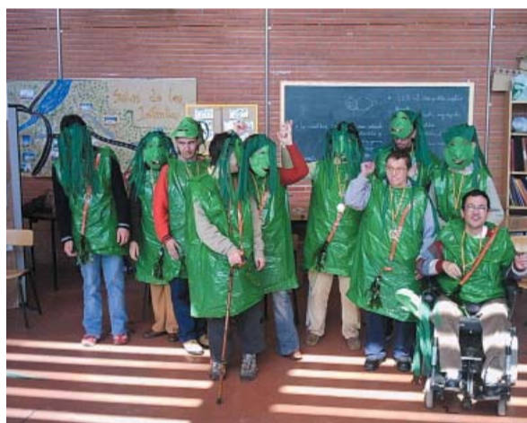
En el centro de Salas de los Infantes, de bruj@s.