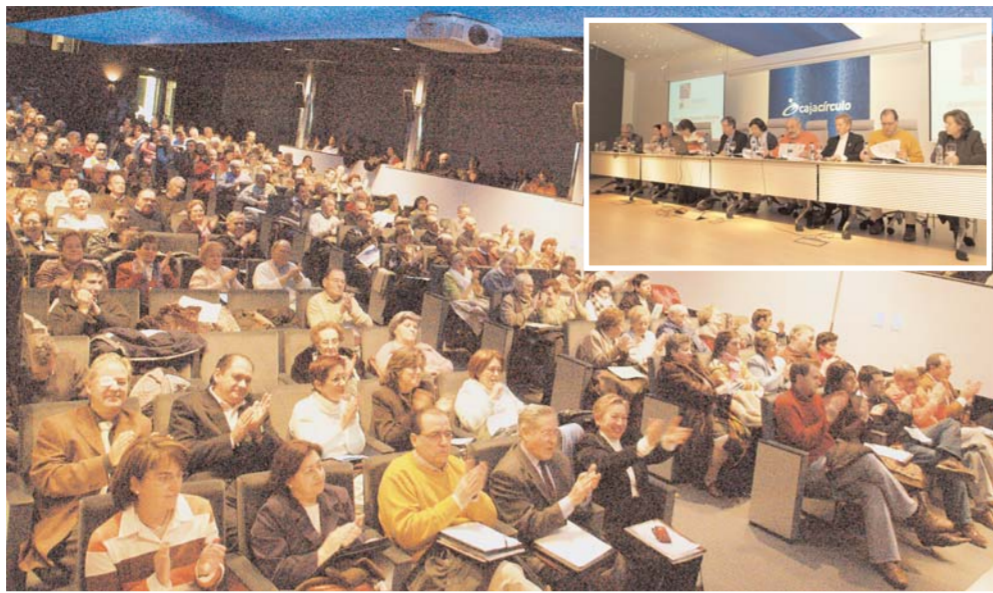
Aspanias cerró el año con la celebración de la última Asamblea General de Socios (18 de diciembre). En la misma se hizo balance de 2005, se presentó el Presupuesto económico y las líneas maestras de actuación para 2006. Los socios conocieron igualmente el Plan de Actuación para este año centrado en el desarrollo de la organización.