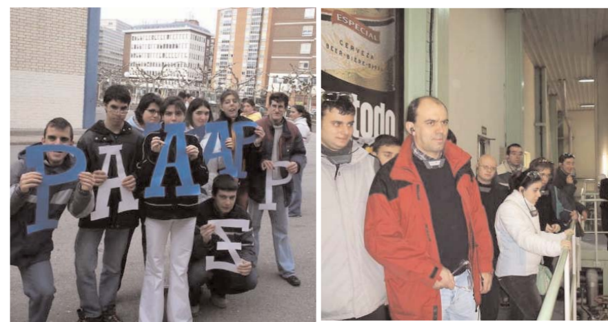
Alumnos del Centro Puentesauco se sumaron a la celebración del Día Mundial de la Paz y la No Violencia.