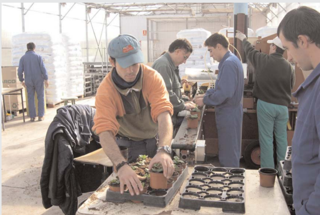
Trabajadores der la planta de viveros, en Quintanadueñas.

Aspanias trabaja desde hace seis años con un modelo nuevo de intervención en la búsqueda de empleo de la persona con discapacidad intelectual (DI). Se llama "itinerarios individualizados de tránsito al empleo" y consiste en entender el itinerario como un conjunto de acciones, perfectamente coordinadas y planificadas entre los profesionales, la familia y la persona con DI, desde que se forma hasta que consigue un trabajo.