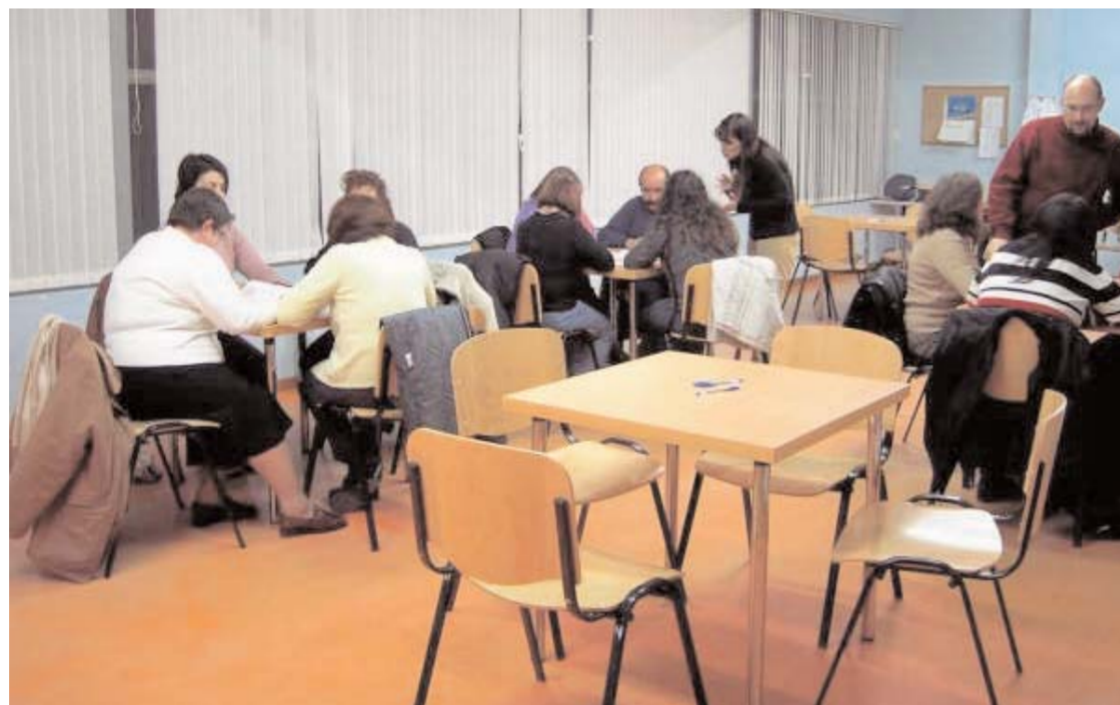
Padres y madres de alumnos de Puentesaúco, en la Escuela de Padres.