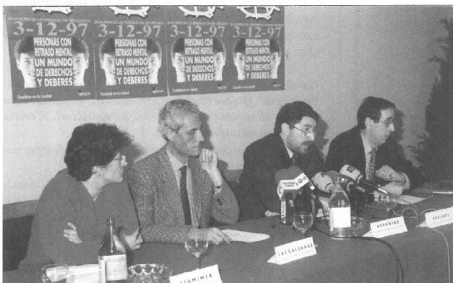
Rueda de Prensa. Día Europeo de las Personas con Discapacidad

(Extracto del pregón de D. Isidro - 21-12-96)