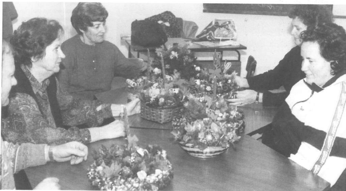
Taller Padres. Centros navideños

Todos podéis enviar sugerencias para la marcha y avance de los grupos.