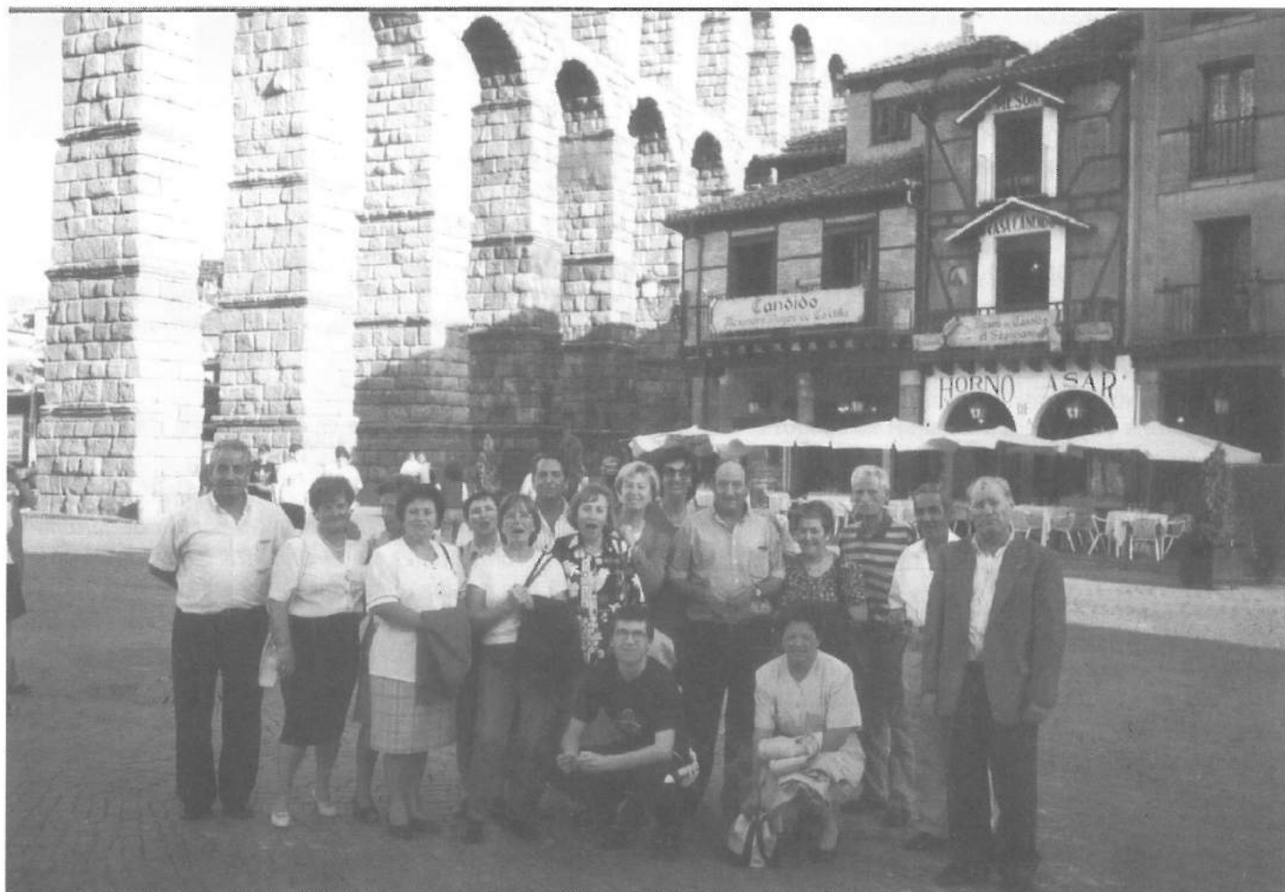
Encuentro familias FECLAPS - Segovia

Según el Real Decreto, 1647/1.997 de 31 de Octubre sobre Prestaciones de Incapacidad Permanente y muerte y supervivencia, os comunicamos unos asuntos de gran importancia: