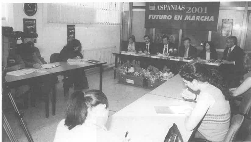
Presentación de la Campaña de Presencia Social de ASPAÑIAS-2001 a los medios, arropados por el Ayuntamiento, la Diputación y la Gerencia de Servicios Sociales, con el slogan: «Un futuro en Marcha» para toda la campaña y «Diferentes ritmos una misma marcha» para la marcha anual a Fuentes Blancas. (25-05-01).