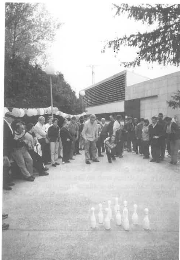
III Jornada de convivencia «Día del Queso»

A todos los que deséis incorporaros, ¡venid!, hay sitio para vosotros a nuestro lado.