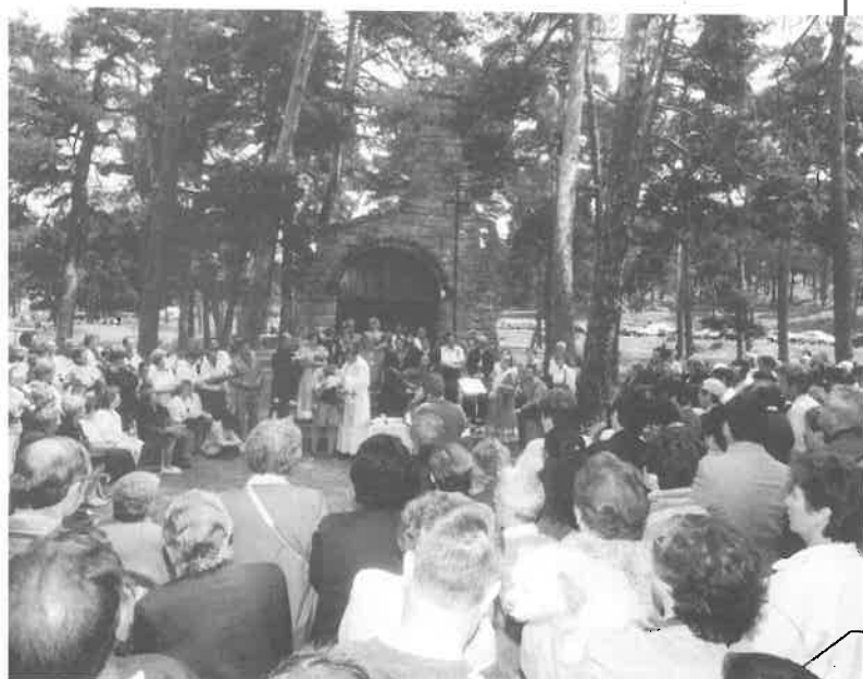
Misa Rociera. Quintanar'01