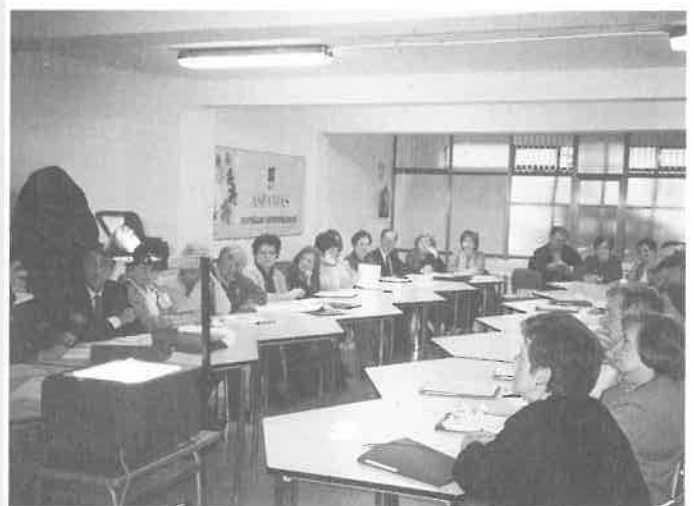
Curso de formación para padres y familiares participantes en el Programa de Participación Asociativa de ASPANIAS

De hecho ya estamos en marcha. Deseo que, si alguna vez tenéis necesidad de acudir a ellos, «no lo dudéis».