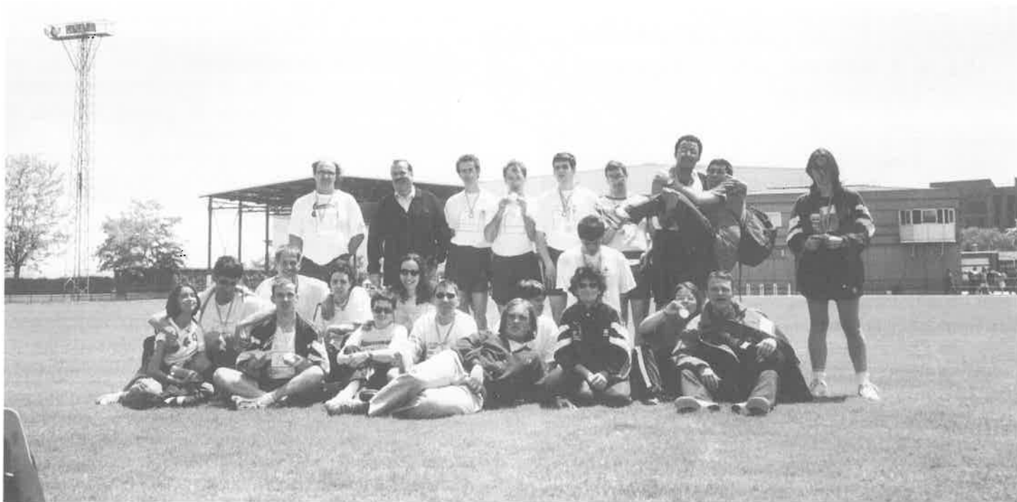
Campeonato Regional de Atletismo. Valladolid