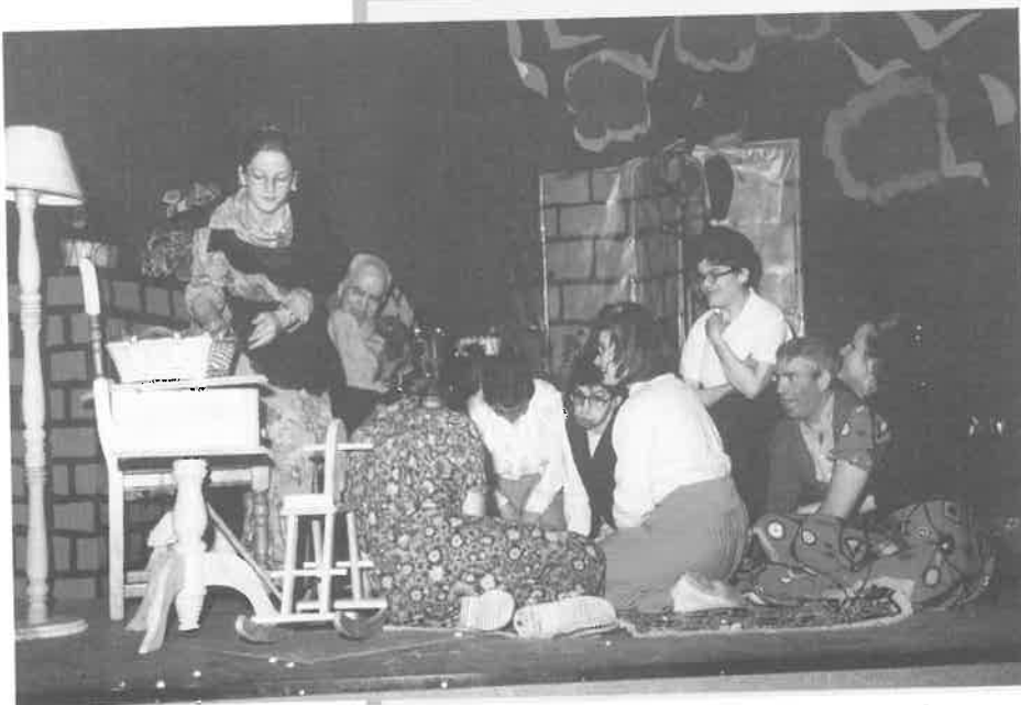
Obra de teatro «La piedra que quiso volar», de la Unidad Asistencial

Seguimos hasta Puentevedy y volvimos a Quintanilla Valdebadres a por la furgoneta. Por la carretera fuimos riéndonos de lo que nos había pasado, tanto que lo pusimos el nombre de «Indiana Jones y la última Capea».