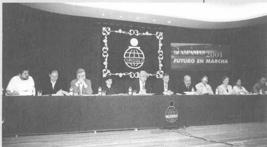
Asamblea General de Socios de ASPANIAS, 20-05-01

Así pues, afirmamos de nuevo que un mejor futuro para las personas con discapacidad va a depender en buena medida de la colaboración entre padres y profesionales. Y afirmamos que para que ésta se dé no basta con que tengamos la buena intención de realizarla, sino que procede un debate y una clarificación a todas las instancias de los roles específicos de unos y otros».