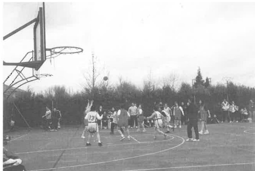
Partido de Baloncesto del equipo femenino