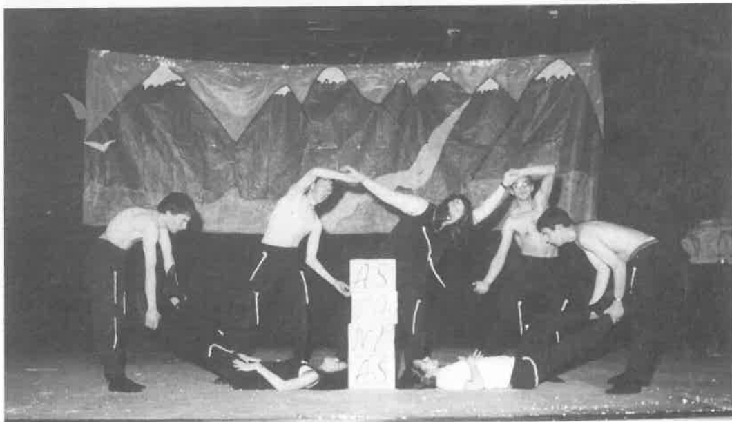
Apertura de la Campaña con una Velada Cultural en la que los protagonistas fueron las propias personas con discapacidad, representando la obra teatral «La piedra que no quiso volar» y diferentes Bailes (26-05-01).