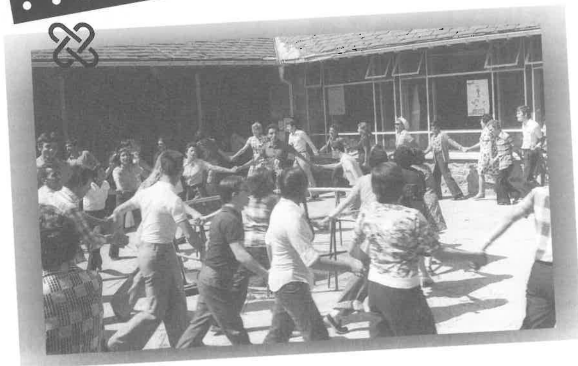
Años 70. Día de las familias en Espinama. «Primeras vacaciones de nuestros chicos»