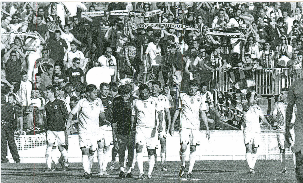
Los jugadores del Burgos CF regresan cabizbajos después de acercarse a la grada para agradecer el apoyo de la afición.