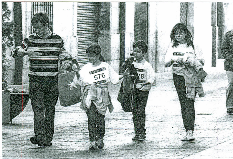
Una familia, durante la participación ayer en la prueba de orientación solidaria.